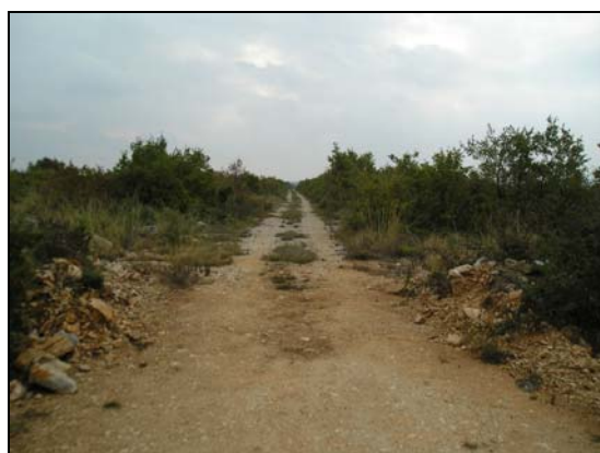
- pogled na županijsku cestu Ž6007 i šumsku prosiku