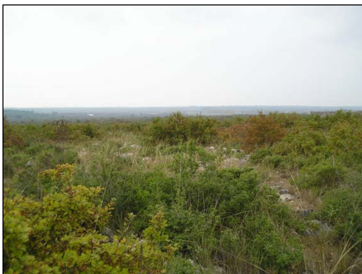
- prostor obuhvata plana